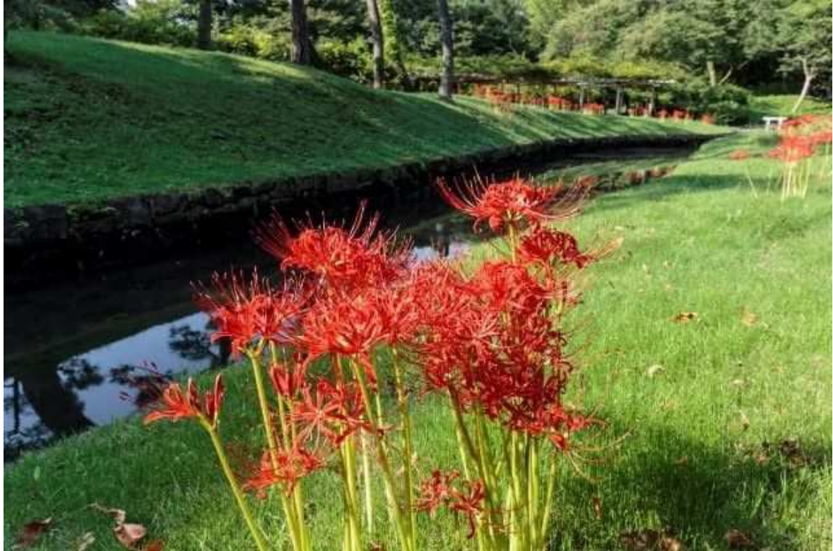
【神田上水跡に咲くヒガンバナ】