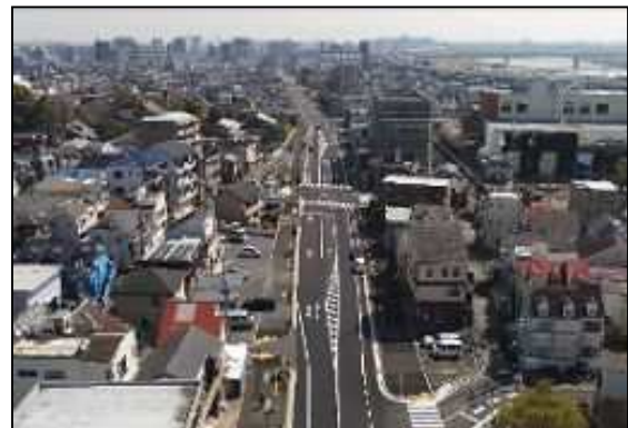
【関原工区上空から東側を望む】