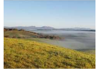
【神秘的な朝の風景】

滞在中、天気の良い朝は、気分転換を兼ねて 1 時間ほど、広い牧草地を自由に散策している。散策をしているとこちらでは見られないスケールの大きな美しい風景を楽しむことができる。運が良ければ牧草を食べに来たエゾシカの親子、食べ物を探しに来たキタキツネ、タンチョウなど北海道固有の野生動物に出会うことができる。