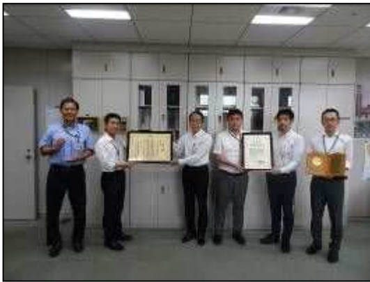
【都技監へ受賞報告】

特定整備路線の整備により、災害時における市街地の延焼防止、避難路や緊急車両通行路の確保など、木密地域の防災力強化に大きく貢献したことが評価されました。