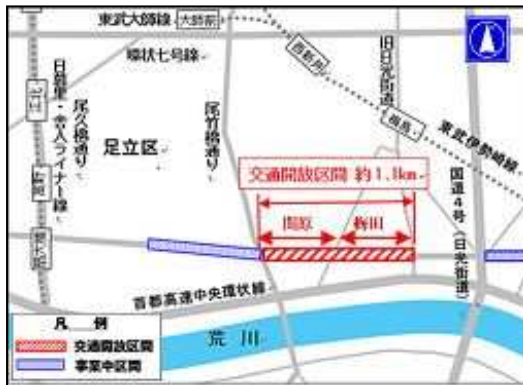
【補助第136号線（関原・梅田）概要図】

本事業は、「木密地域不燃化10年プロジェクト」実施方針に基づき、特定整備路線として指定した補助第136号線（関原・梅田）において、延長約1.1km（旧日光街道から尾竹橋通りまで）の整備を行ったものです。令和3年3月29日に特定整備路線として初めての交通開放を実現しました。